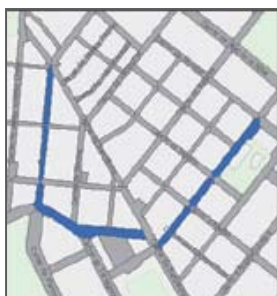
Vías de ACCESO PRINCIPALES