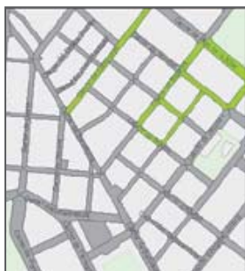
Zonas de OCIO